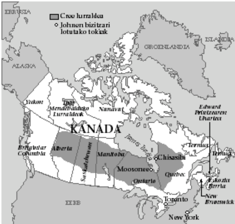
Cree lurralde osoa eta Johnen bizitzari lotutako tokiak.

rako gutxiengoak —txinatarrak, filipinarrak, korearrak...— banaka agertzen diren bitartean, herri natibo-amerikarrak denak batera eta zaku berean agertzen baitira, bakoitzaren nortasuna —Cree, Innu, Ojibwa, Mohawk...— kontuan hartu gabe.