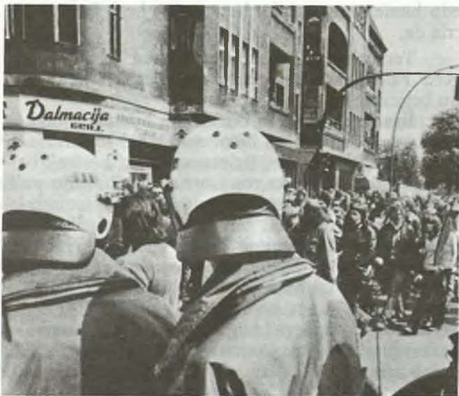
Baader bandaren aldeko manifestapen bat

Baaderek ez du jakin herriarekin bat egiten. Arraina uretan bezalatsu bizi behar omen du gizartean iraultzaileak. Ez da hemen holakorik gertatu, ez hurrik ere. Terrorismo hau, Daniel Cohn-Bendit jaunak (hots, Frantziako Maiatza 68ko buruetako bat) deklaratu duenez, politikazko desesperantzaren erarik burutuena besterik ez da. Jokabide honen Estatuaren arrazoiari arrazoi ematea lortu du, zoritxarrez. Halegia, Estatu gogortzea, indartzea, eta kontrakolpe, ezkertiarak, sozialistak, ixileztea.