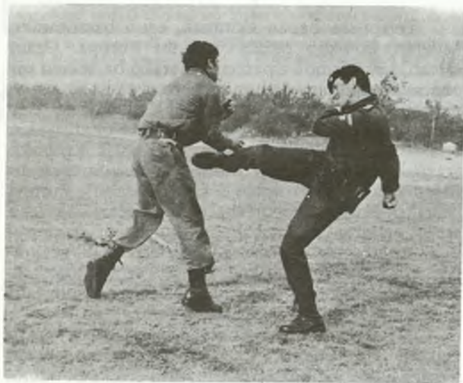
Polizia espezializatuen entrenamenduak