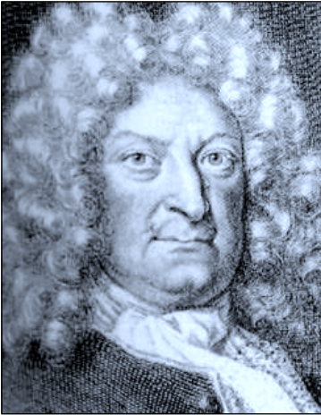
Gottfried W. Leibniz.

(“das allgemeinste Bestreben der menschlichen Vernunft”)