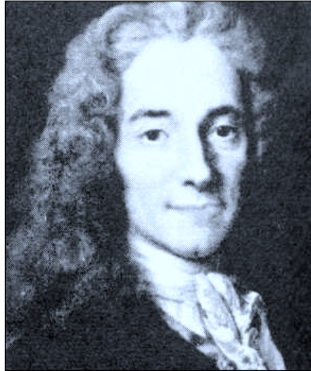
Francois-Marie Arouet, Voltaire.

Voltairei jarraitu zaion historiaren filosofia modernoaren hastapenetan aurkitzen gara giza historiari buruzko Humboldten pentsamenduan. Lessingi ("Gizadiaren hezibidea"), eta batez ere urte batzuk lehentxeagoko Herder eta Kanten arteko auziari jarraiki, Humboldt gazteak bere eritzi propioa osatu gura izan du gai eztabaidatu honetan ere. Erraztasunaren arrazoiagatik bakarrik, beste inplikazio sakonagorik gabe, Humboldten pentsamenduaren eboluzioa, historiari gagozkiola, bi periodotan banatuko dugu, kasik modu itxuragabe batean, XVIII. mendeko testuetan eta XIX.ekoetan biak banatuz. Egiaz Humboldten pentsamendu historikoa poliki-poliki heldu da 2 , bere interes eta intuizio nagusiak jada lehen eskuizkribuetan presente badaude ere. Lehen periodo horri bilaketarena deituko diogu eta berau soilik izango da lerro hauetan gure gaia.